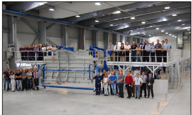
Livraison de la première trappe de train d'atterrissage principal de l'A350-1000